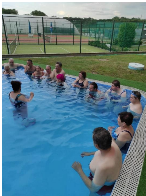
Benešov 2023 – Cvičení v bazénu

Termíny: 15. – 17. 9., 6. – 8. 10. 2023 (pátek – neděle) Cena: 2. 995 Kč/os. , v případě dotace cenu snížíme o přiznanou částku Cena obsahuje: ubytování včetně plné penze a pitného režimu (voda/voda se sirupem) + 2x bowling + minigolf + pétanque, kurz 1. pomoci, účastnický příspěvek Doprava: individuální vlakem (před nádražní budovou stojí taxi a do hotelu stojí 50Kč), každý v rámci svých možností, můžete si objednat bezbariérovou dopravu z Prahy – www. Bezba.cz , tel. 234 704 572 Doporučení: kapesné ve výši 300Kč na zakoupení pití a dalších drobností Plná penze obsahuje: hotelovou snídani: teplý bufet - vajíčka, párky apod., káva, čaj, džusy, mléko, cornflakes, müsli, ovoce, koláč, sýry, uzeniny, máslo, džem... oběd: výběr z předem připraveného jídelního lístku, večeři: výběr z předem připraveného jídelního lístku. Nápoje vždy k obědu a večeři (voda/voda + sirup) v ceně plné penze, ostatní si hradí každý sám. Těším se na vás Dana Lacinová, tel.: 606 511 304, e-mail: pipi.puncochata@seznam.cz