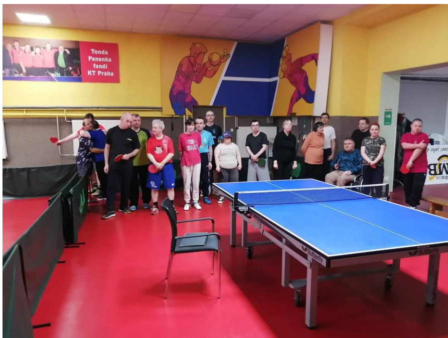
Jarní turnaj ve stolním tenisu jednotlivců 2023