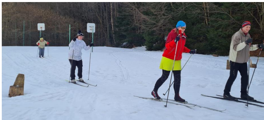
Jánské Lázně 2023