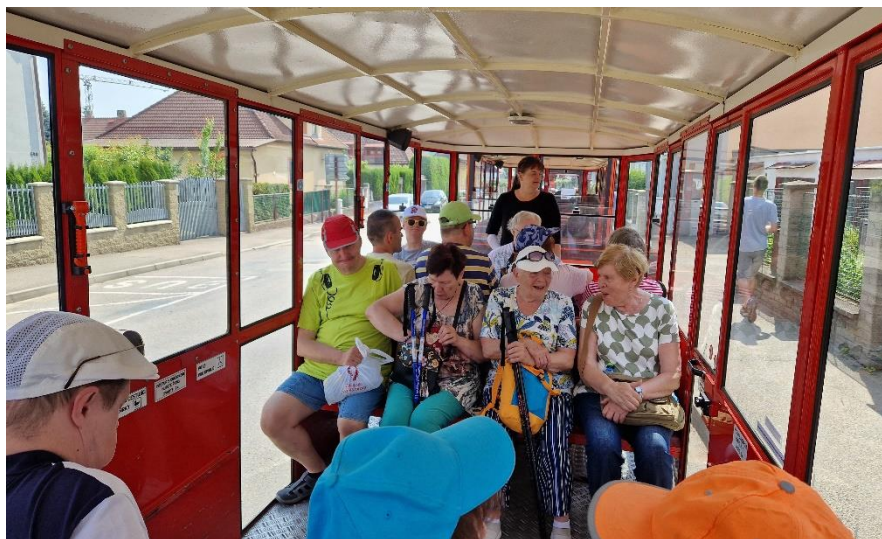
Benešov 2023 - Cesta vláčkem na Konopiště