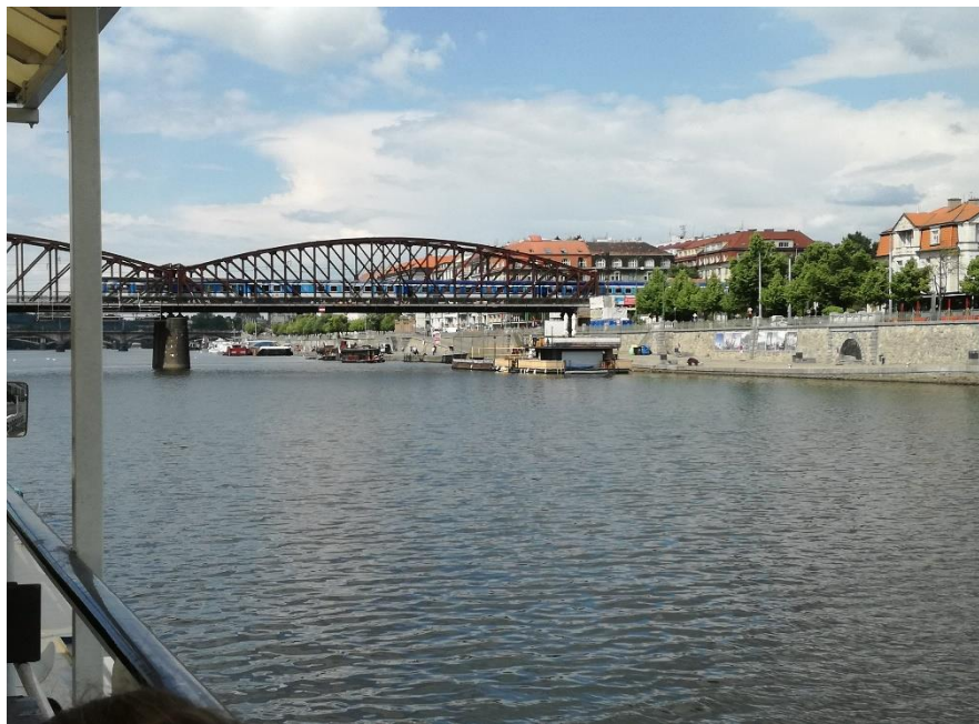
Plavba po Vltavě