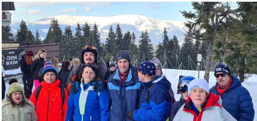
Jánské Lázně 2023