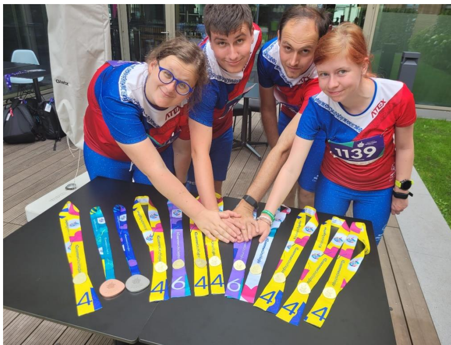
Mezinárodní hry Speciálních olympiád v Berlíně