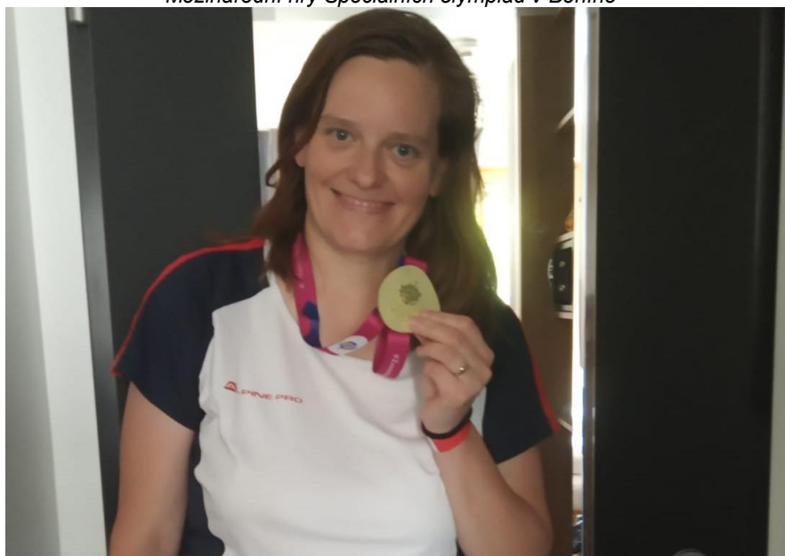
Mezinárodní hry Speciálních olympiád v Berlíně